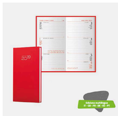
Agenda giornaliera tascabile