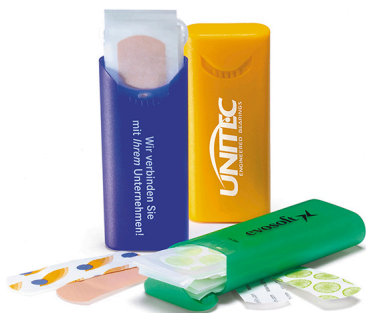
Astuccio Cerotti 10PZ 80x35x15 mm Colori